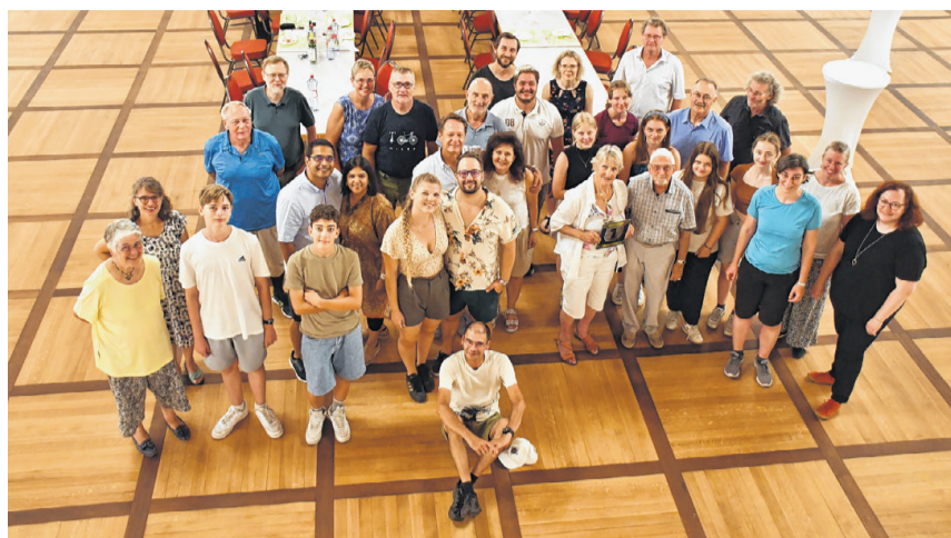
Die Gäste des Jubiläumsanlasses im Landgasthofsaal nach dem Nachtessen.

Ursprünglicher Vereinszweck war es, das Bogenschiessen als Schulsport zu etablieren und den Nachwuchs für die Sportart zu sichern, die 1972 in München erstmals seit 1920 wieder olympisch gewesen war und es bis heute geblieben ist. Dieser Fokus auf den Nachwuchs erklärt auch den Vereinsnamen – «Juventas» verweist auf die römische Göttin der Jugend. In den 1980er-Jahren feierte der Verein erste sportliche Erfolge, im Jahr 1981 wurden gleich sechs Vereinsmitglieder ins Schweizer Nationalkader aufgenommen.